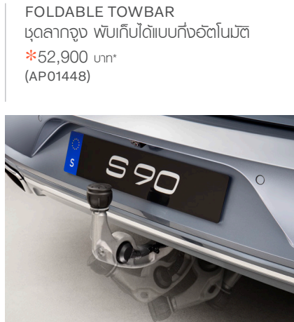
FOLDABLE TOWBAR ชุดลากจูง พับเก็บได้แบบตั้งอัตโนมัติ *52,900 บาท* (AP01448)