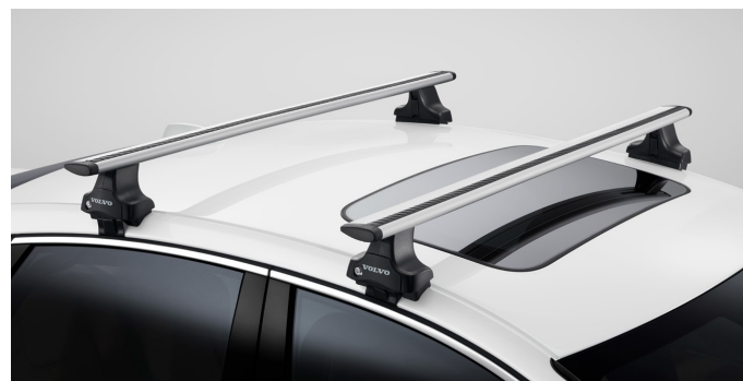
LOAD CARRIER ราวบรรทุกสัมภาระ *15,500 บาท* (P/N : 32296509)