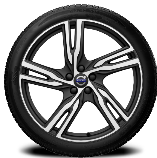
20 นิ้ว ลาย 5 ก้านคู่ สีดำด้าน แบบ DIAMOND CUT พร้อมยาง *225,000 บาท* (AP01370)