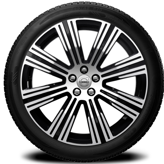
20 นิ้ว ลาย 8 ก้านคู่ สีดำ แบบ DIAMOND CUT พร้อมยาง *225,000 บาท* (AP01370)