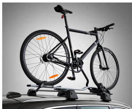
BICYCLE HOLDER, ROOF-MOUNTED ชุดจับยึดจักรยาน *8,900 บาท* (P/N 31664408)

หมายเหตุ : ราคาไม่รวม Adapter สำหรับจักรยานพิเศษ และ Adapter สำหรับ Connector IIU 7 Pin