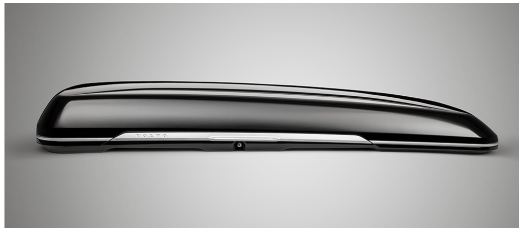
ROOF BOX, DESIGNED BY VOLVO CARS. กล่องเก็บสัมภาระบนหลังคา *85,900 บาท* (P/N : 32296385)