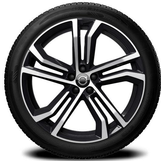
20 นิ้ว ลาย 5 ก้านคู่ สีดำ แบบ DIAMOND CUT พร้อมยาง *225,000 บาท* (AP01370)